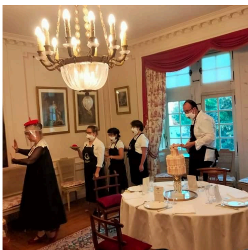
Les serveurs dans la Salle du Banquet