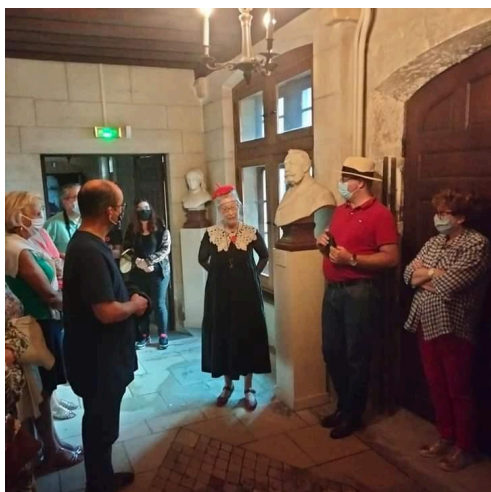
Miss Evans reçoit