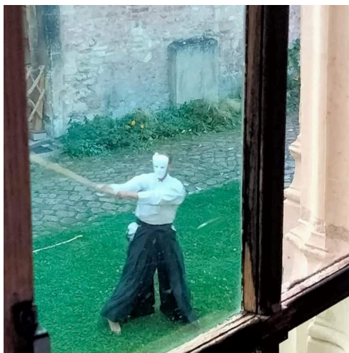
Aikiryu dans les jardins du Vergeur